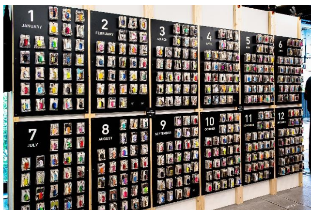
<「Acryl Tag Plate 365」POPUPショップイメージ>

『NEWSED』は、多種多様な産業で生産時に出る端材や回収した部材から、新しい関係性と価値を結びつけるデザインに取り組むアップサイクルブランドです。今回は、『NEWSED』の人気商品として、アクセサリーや店舗什器の製造過程で出た廃棄予定だったアクリル端材を活用して作られたタグプレート「Acryl Tag Plate 365」に特化したPOPUPショップが登場いたします。本POPUPショップが東京都以外で出店するのは初となります。また、POPUPショップ期間中、1年分（※2月29日もご用意あり）のアクリルタグプレートが揃っている店舗は横浜赤レンガ倉庫のみです。