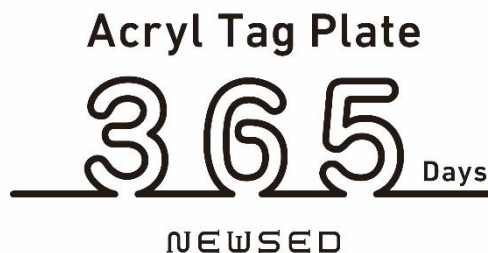
<「Acryl Tag Plate 365」POPUP>