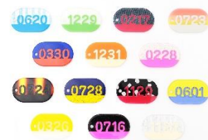
「Acryl Tag Plate 365」商品イメージ