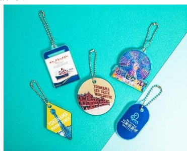
「横浜愛ガチャ」商品イメージ